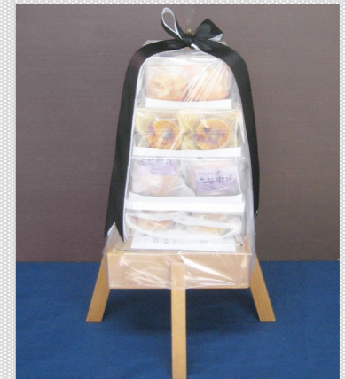
(写真は盛菓子・半対 税込8,100円)

*のついている商品は軽減税率対象商品です。 ご供物だけでもお気軽にご用命ください。ご希望の金額・内容にて承ります。