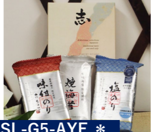
SL-G5-AYE * 焼海苔・味海苔・塩海苔 焼海苔 8切6枚×1 味海苔 8切6枚×1 塩海苔 8切6枚×1