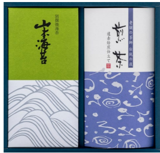
SL-MT-BN * 山本海苔・深蒸煎茶詰合せ 山本海苔 別撰焼海苔半切3枚×3袋 深蒸煎茶(かぶせ仕立て) 80g