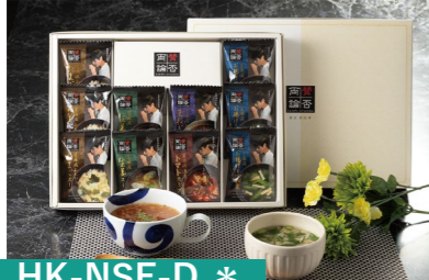
HK-NSF-D * 賛否両論 笠原将弘監修 フリーズドライスープ 国産生姜スープ×2・国産玉ねぎスープ×1 たまごスープ×3・濃厚トマトスープ×1 お揚げと小松菜のスープ×3