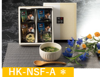
HK-NSF-A * 賛否両論 笠原将弘監修 フリーズドライスープ たまごスープ×1 国産生姜スープ×1 お揚げと小松菜のスープ×2