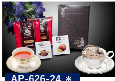
AP-626-24 * コメダ珈琲・紅茶 コメダ珈琲ドリップ×2袋 JAFティー (ピーチ・フルフル・パー)×各1袋