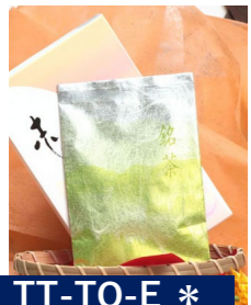
TT-TO-E * 上級煎茶箱入 煎茶 40g