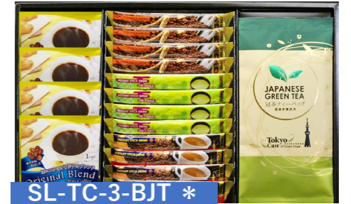
SL-TC-3-BJT * お茶・コーヒー・東京カフェセット

国産生姜スープ×2・濃厚トマトスープ×1 国産玉ねぎスープ×1・たまごスープ×2 お揚げと小松菜のスープ×2