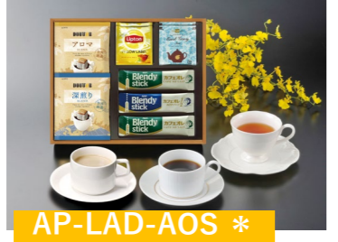
AP-LAD-AOS * ドトール&紅茶 ドトールドリップコーヒー (707mlレド/深煎りブレンド)各1 リプトンイエローラベル 2袋 アールグレイ紅茶ティーバッグ 2袋 ブレンドイシキカカフェオレ 2本 ブレンドイシキカカフェオレ (かりーハー)1本