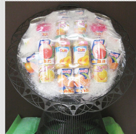
(写真は盛缶詰 税込10,800円)