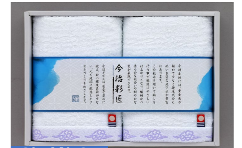
SL-AN-C4 今治 瑞雲 タオルセット

冠茶ティーバック 2g×10袋・ドリップコーヒー×4 スティックコーヒー×4・スティックコーヒー(微糖)×4 スティック抹茶オレ×4