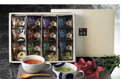
HK-NSF-E * 賛否両論 笠原将弘監修 フリーズドライスープ 国産玉ねぎスープ×2・国産生姜スープ×2 濃厚トマトスープ×2・たまごスープ×3 お揚げと小松菜のスープ×3