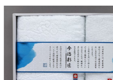
SL-AN-C6 今治 瑞雲 タオルセット