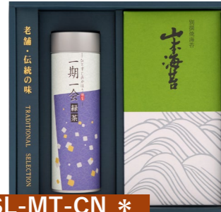
SL-MT-CN * 山本海苔・上級煎茶詰合せ 山本海苔 別撰焼海苔半切3枚×3袋 深蒸上級煎茶(かぶせ仕立て) 80g