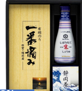
AP-CN * キッコマン・お茶・海苔