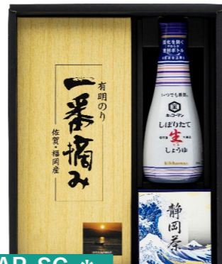
AP-SG * キッコマン・お茶・海苔 キッコマン生しょうゆ200ml×1 深蒸し煎茶90g×1・有明海苔半切7枚×1