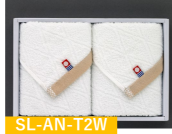
SL-AN-T2W 今治 ウォッシュタオル2P ウォッシュタオル 2枚