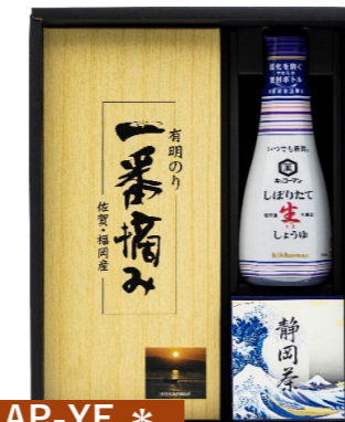
AP-YE * キッコマン・お茶・海苔 キッコマン生しょうゆ200ml×1 深蒸し煎茶90g×1・有明海苔半切7枚×2