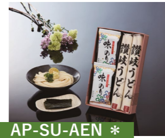
AP-SU-AEN * 讃岐うどん・味のり