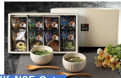
HK-NSF-C * 賛否両論 笠原将弘監修 フリーズドライスープ

国産生姜スープ×2・濃厚トマトスープ×1 国産玉ねぎスープ×1・たまごスープ×2 お揚げと小松菜のスープ×2