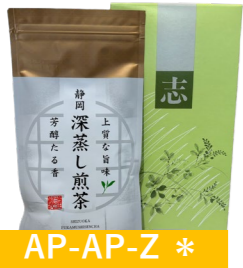
AP-AP-Z * 深蒸し茶 深蒸し茶 100g