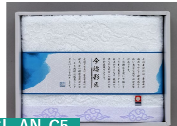
SL-AN-C5 今治 瑞雲 バスタオル