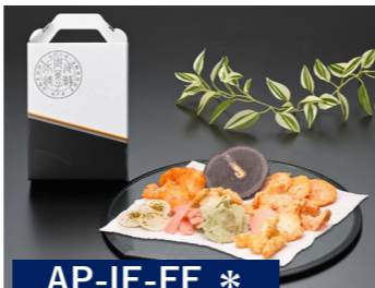
AP-IE-FE * えびせん詰合せ 海老海鮮煎餅