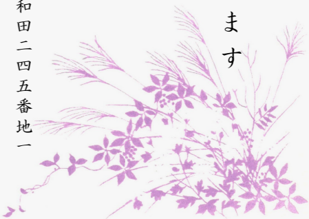
< インクジェット対応 >